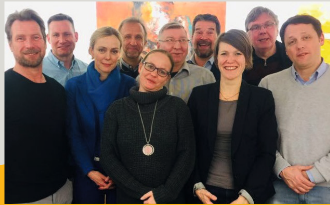
Vorstand der CDU Weißensee