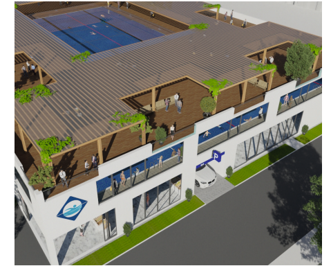
Der neue Pistoriusplatz mit Schwimmbad, Foto: CDU W'See

Wie vereinen wir die Ansprüche aller Weißenseerinnen und Weißenseer? Wie lösen wir unser offenkundiges Verkehrsproblem bei zunehmendem Radverkehr und gleichzeitig wachsender Bevölkerung in Weißensee? Wie erhöhen wir die Aufenthaltsqualität auf dem Pistoriusplatz? Wie verschönern wir den Mirbachplatz? Bräuchte Weißensee nicht auch ein Schwimmbad? Wir haben Antworten auf diese Fragen. Wir haben einen Plan. Diesen wollen wir gerne vorstellen und gemeinsam mit Ihnen diskutieren. (Wir bitten um Anmeldung an: info@dirk-stettner.de , Maske nicht vergessen) Dienstag, 29.09.2020 um 19 Uhr Trattoria Diverso, Behaimstr. 64, 13086 Berlin